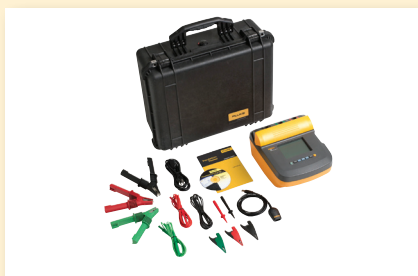
Fluke 1555 Kit per tester per la misura della resistenza d'isolamento