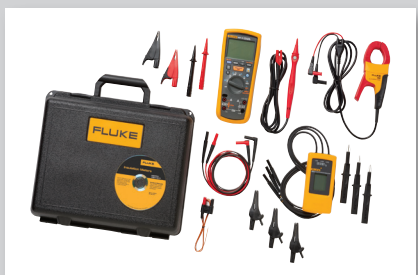
MDT avanzata: Kit di ricerca guasti avanzata su motori ed azionamenti