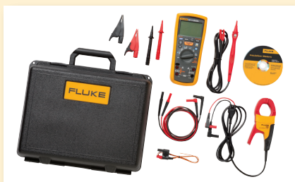
Fluke 1587 FC ET Kit di ricerca avanzata guasti elettrici