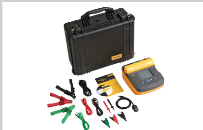
Fluke 1550C Kit per tester per la misura della resistenza d'isolamento