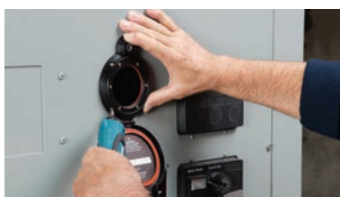
Collegare e fissare il coperchio