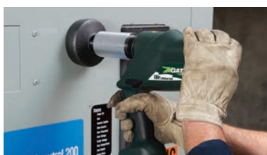
Foro da punzonatura