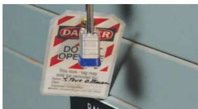
Bloccaggio / sbloccaggio